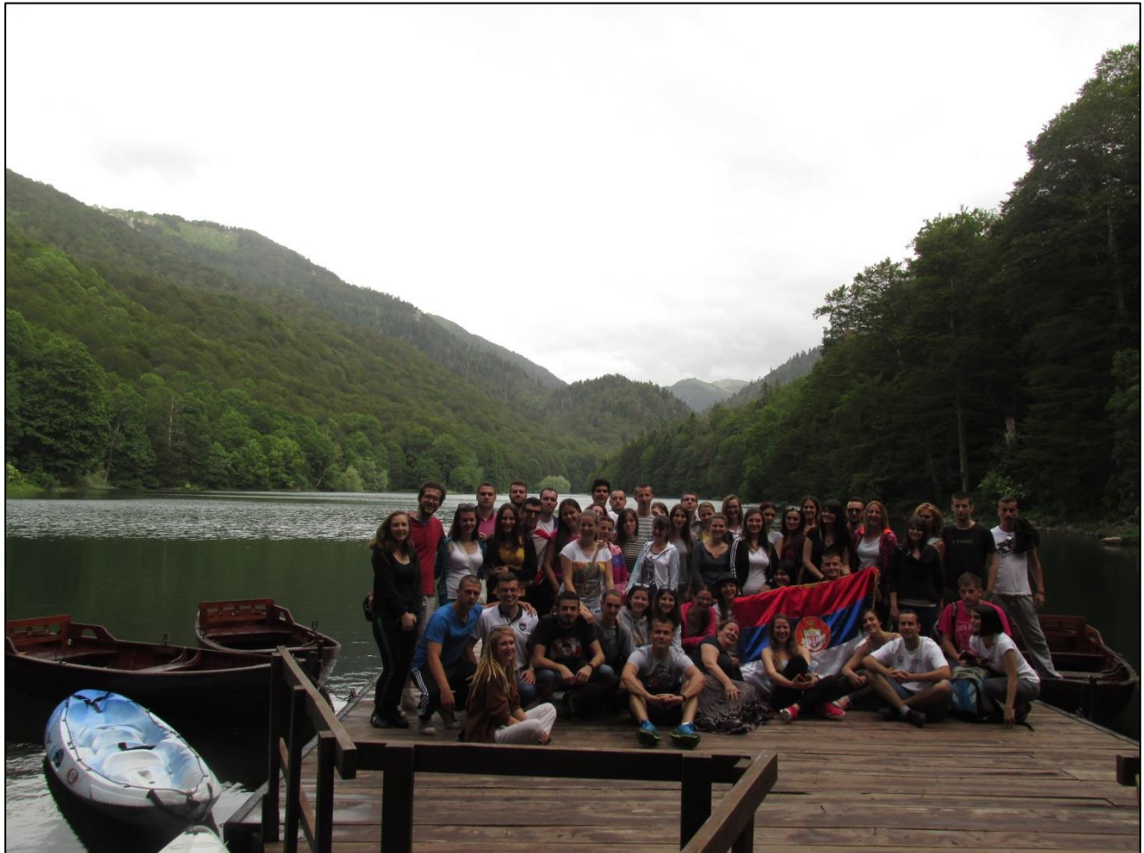
Национални парк Биоградска гора и Биоградско језеро на Бјеласици