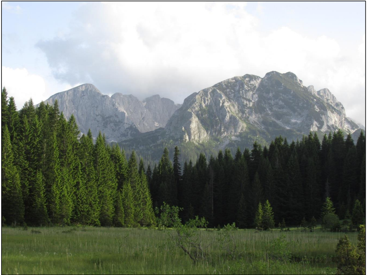
Барно језеро и планински венац Дурмитора