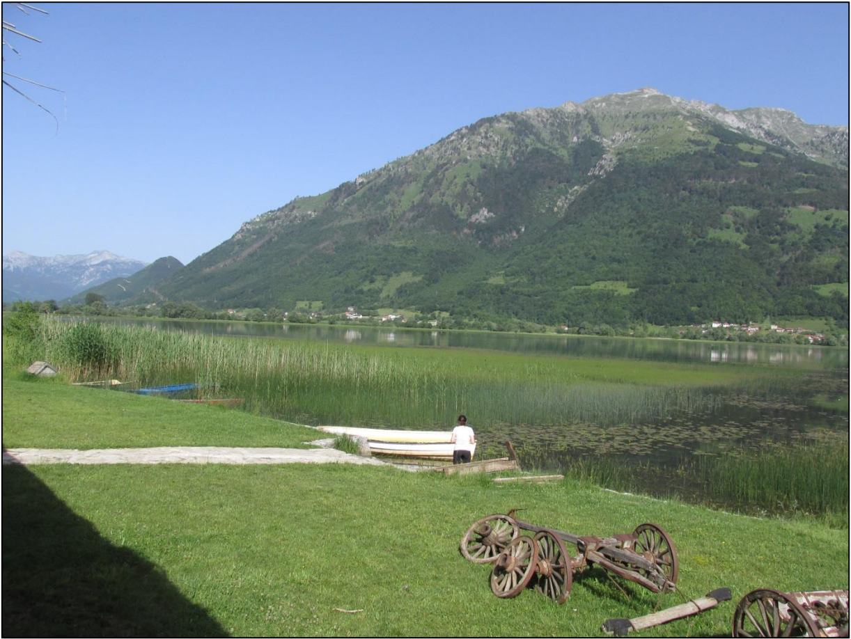
Плавско језеро и планина Виситор