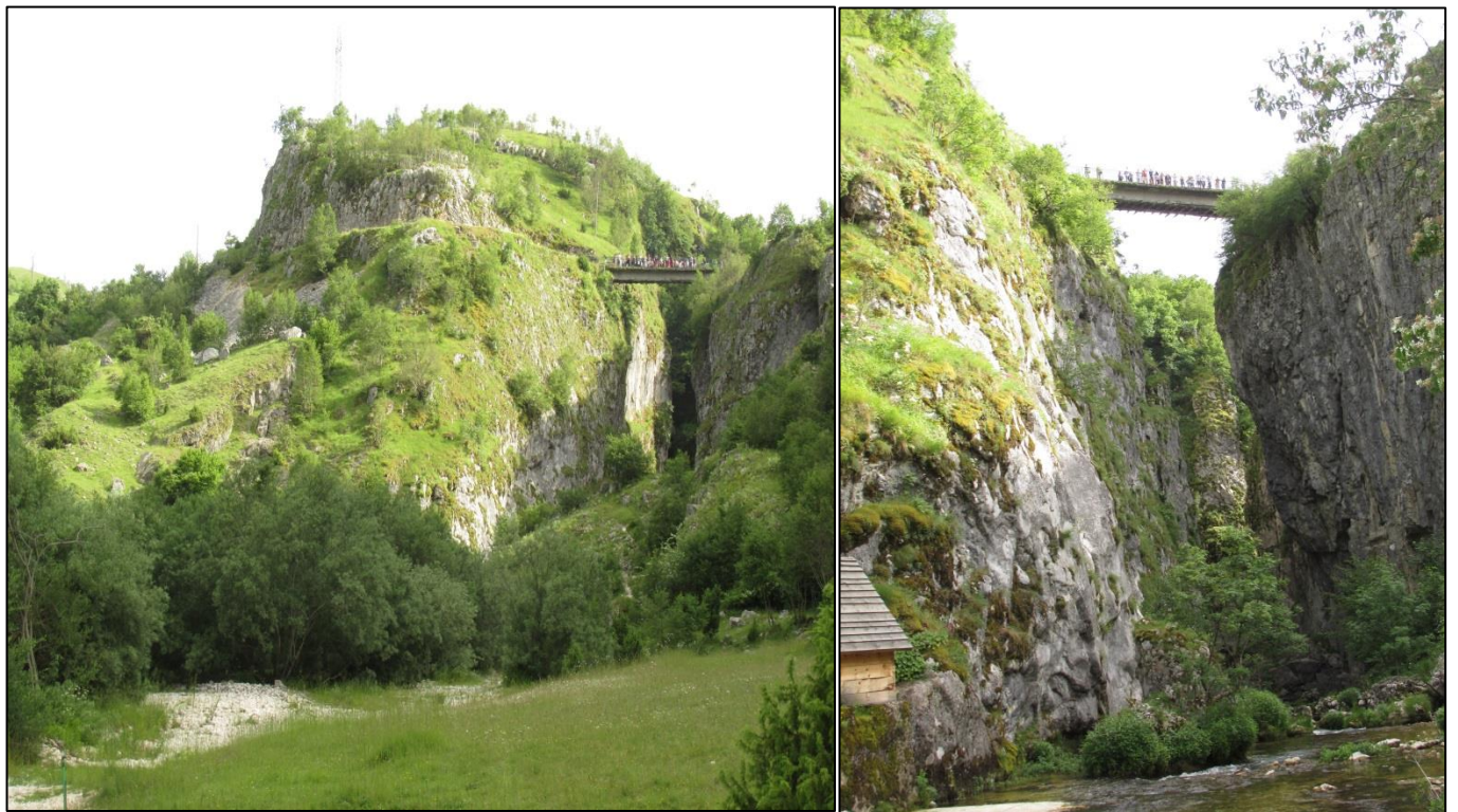
Кањон реке Комарнице – кањон Невидео