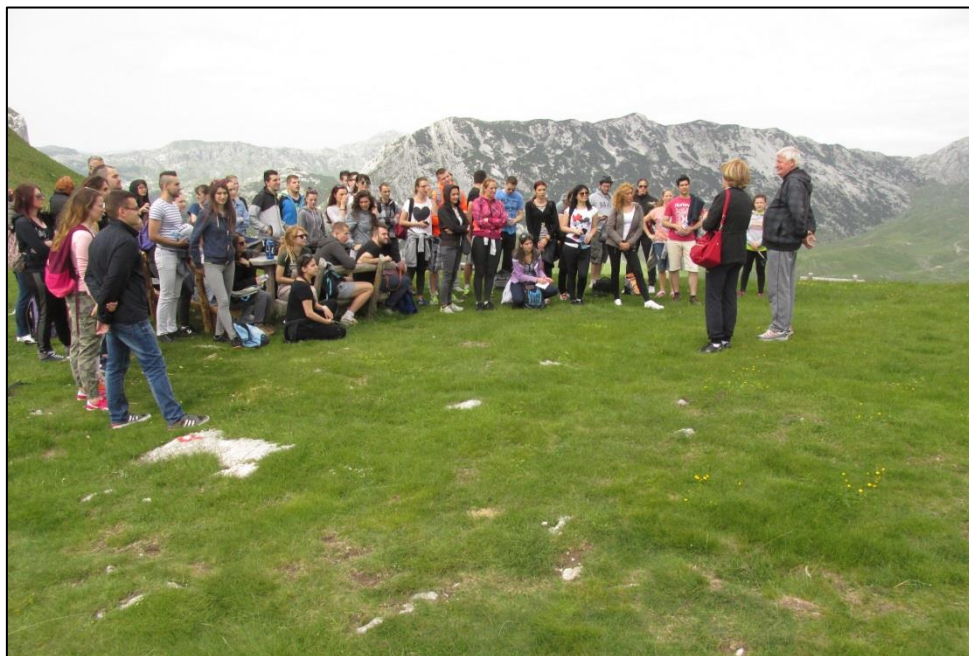
Превој Седло на Дурмитору између цирка Добри до и валова Пошћенске долине