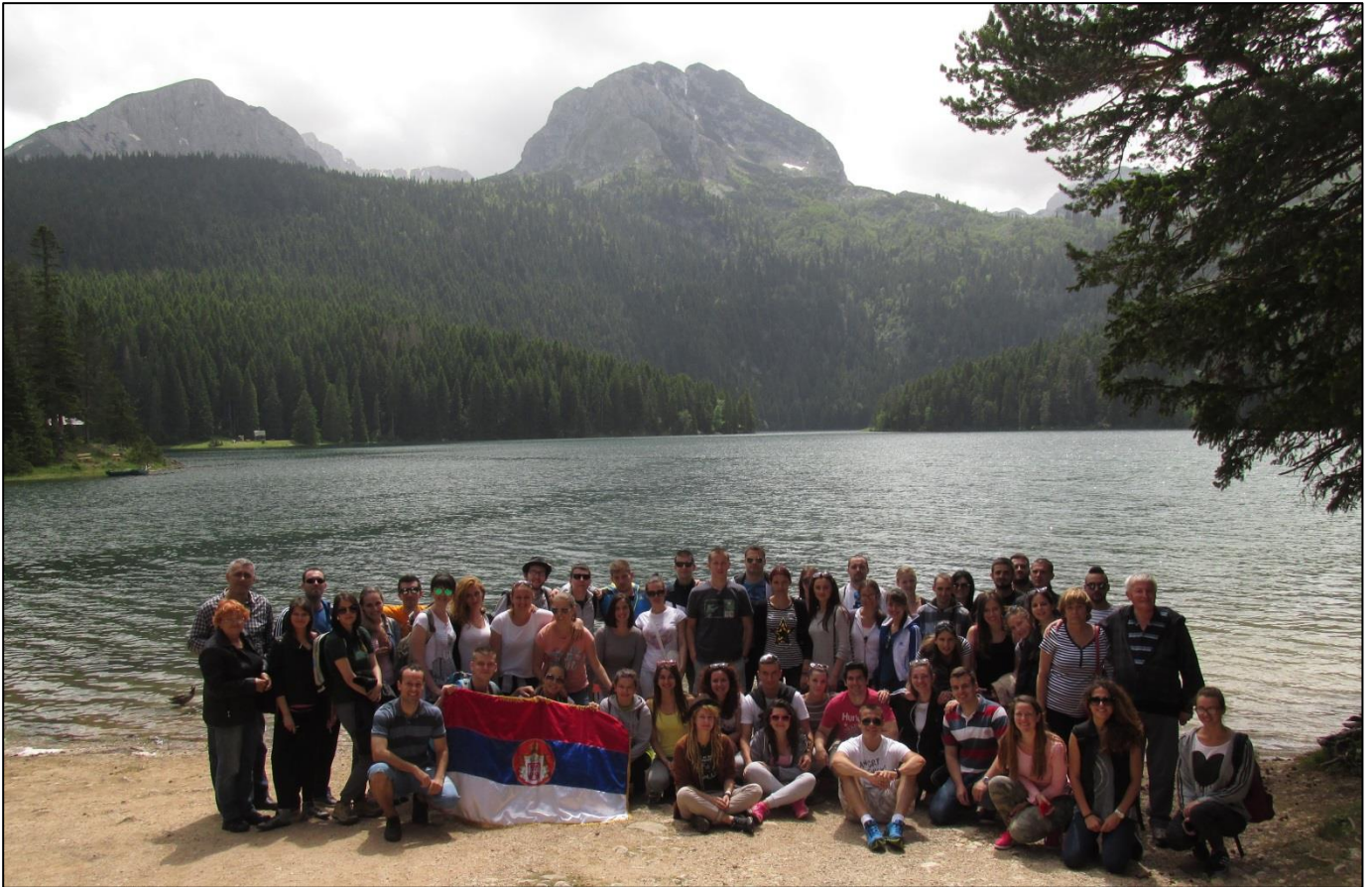
Црно Језеро у подножју дурмиторског врха Мебеда