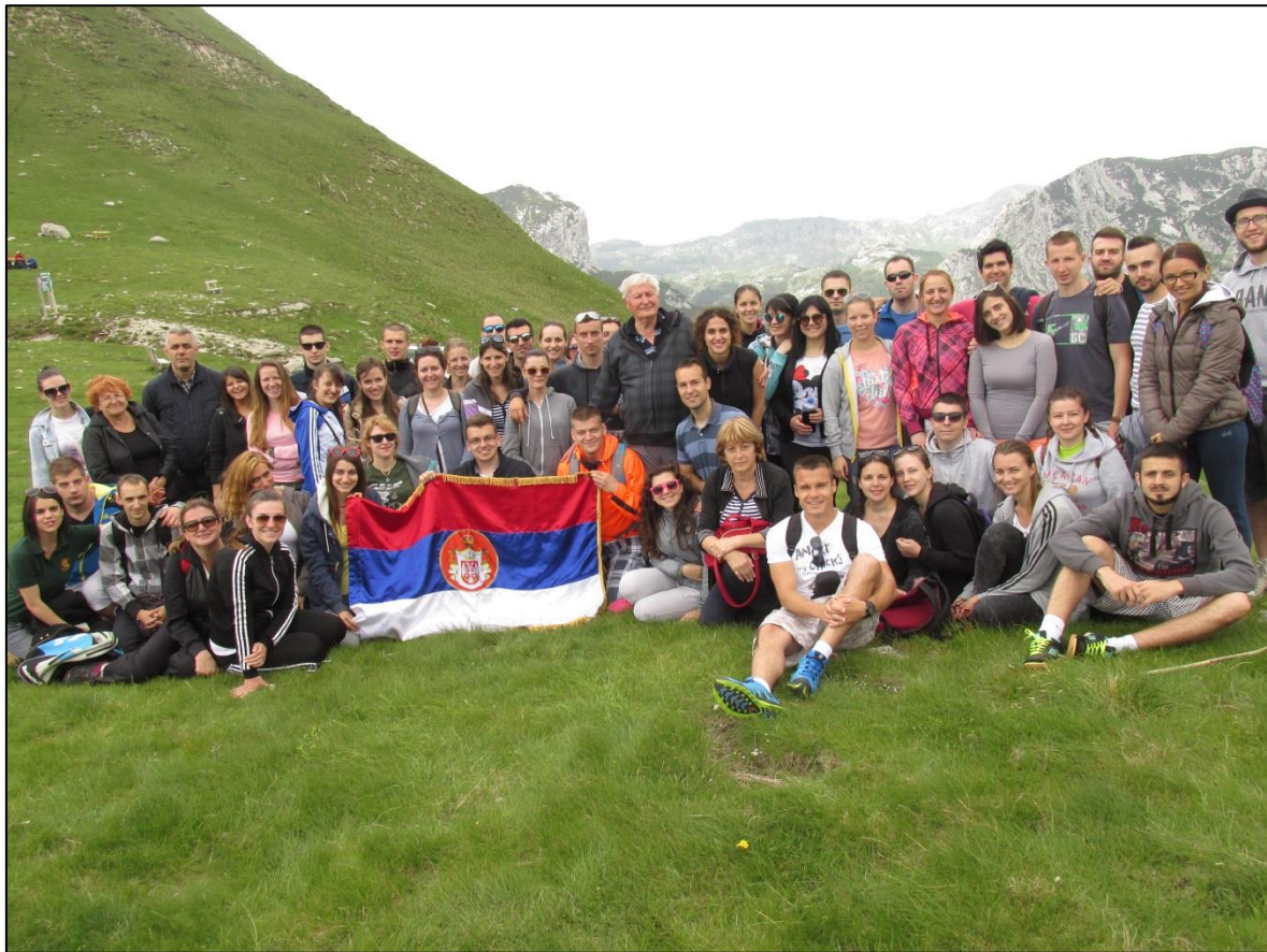
Превој Седло (1907 м н.в.)