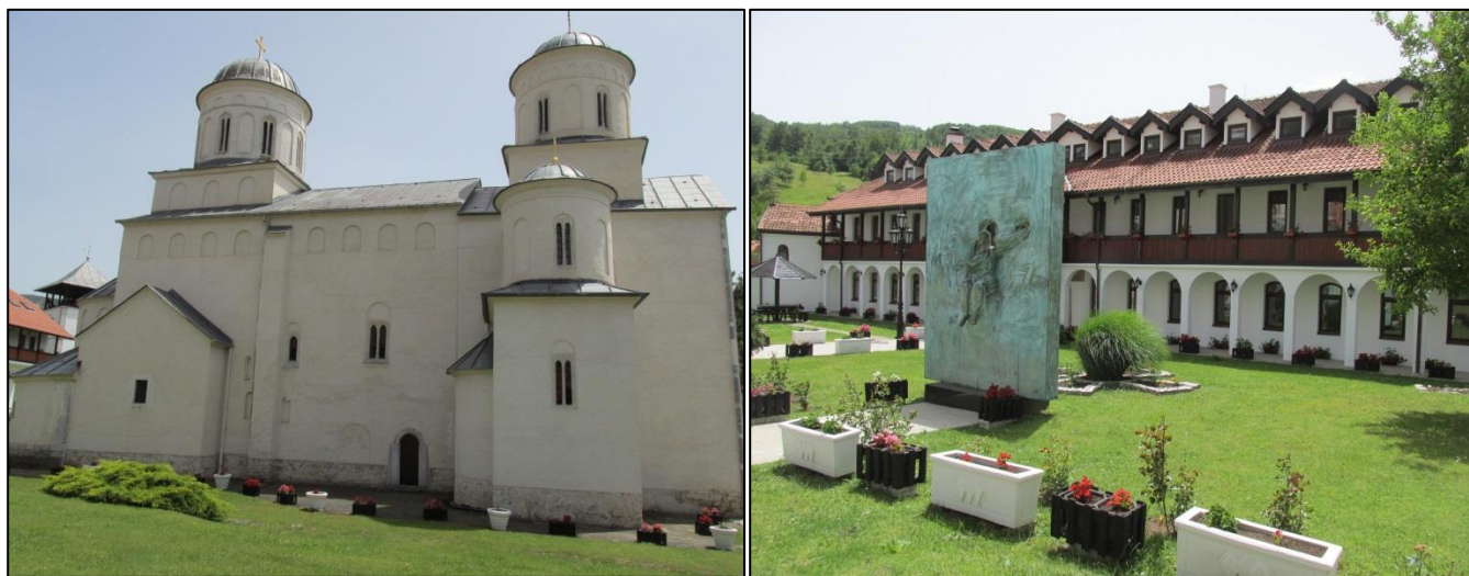
Посета манастиру Милешева (XIII век)