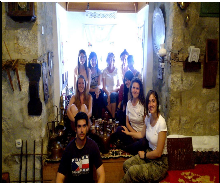
Посета Реџепагића кули у Плаву (XVII век)