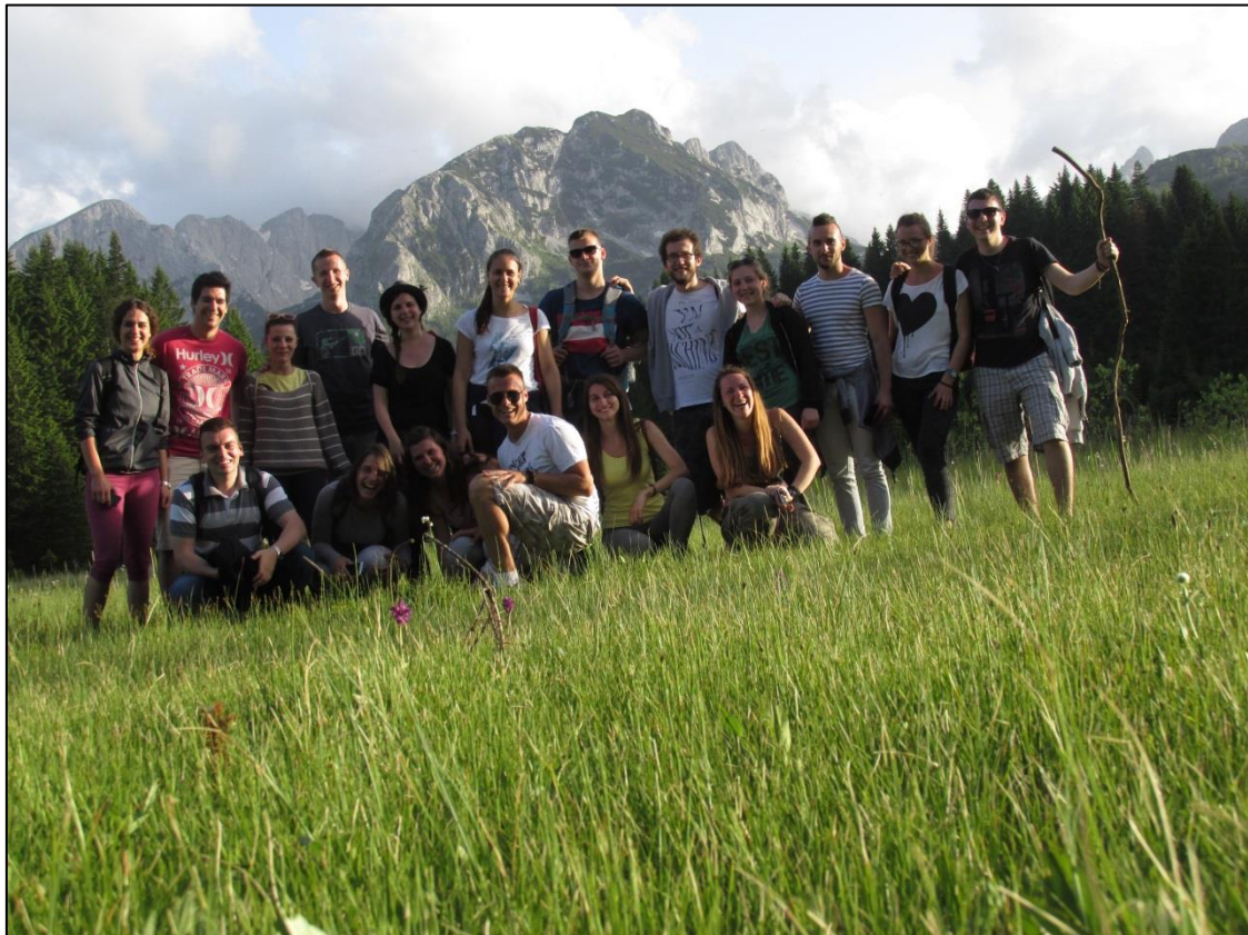
Студенти на Барном језеру