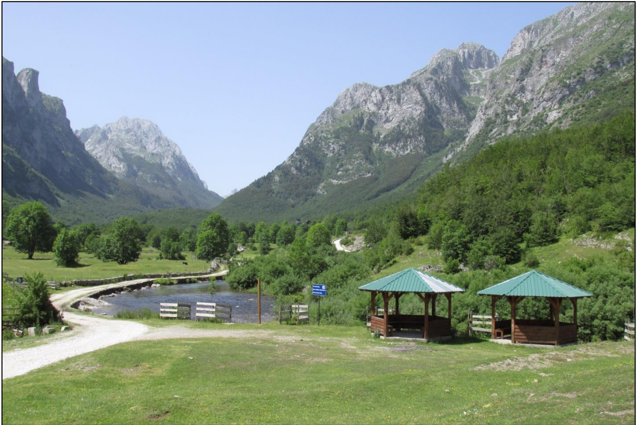
Валов Ропојане на Проклетијама и река Скакавица