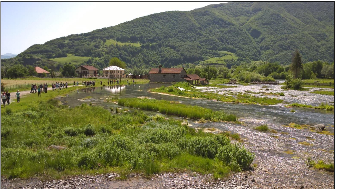
Савини (Алипашини) извори на Проклетијама