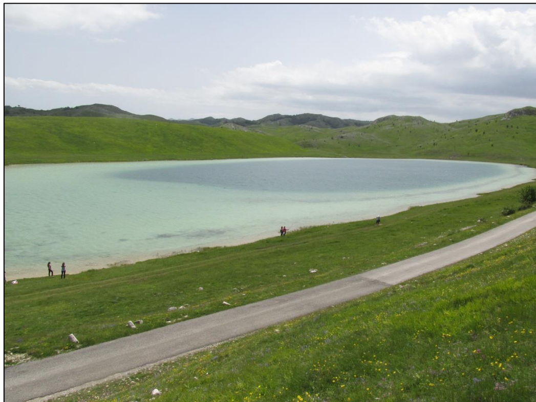
Вражје језеро на Језерској површи