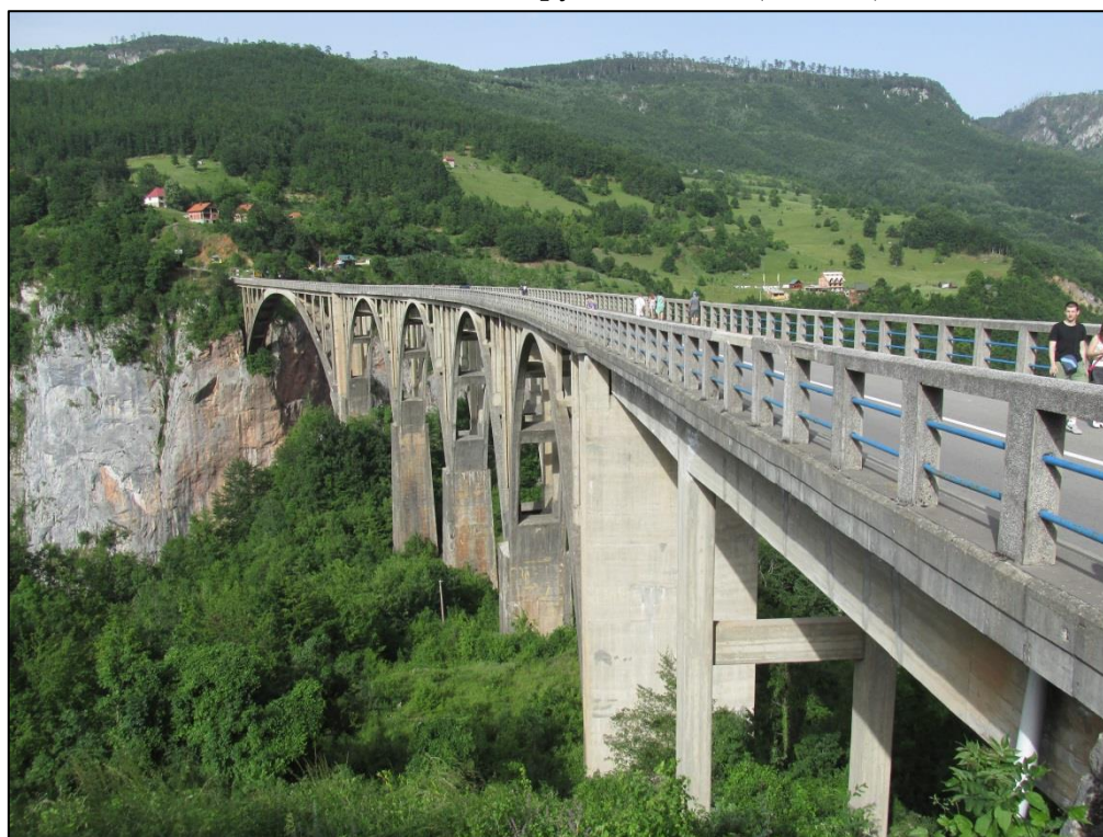
Прелазак преко моста на Ђурђевића Тари