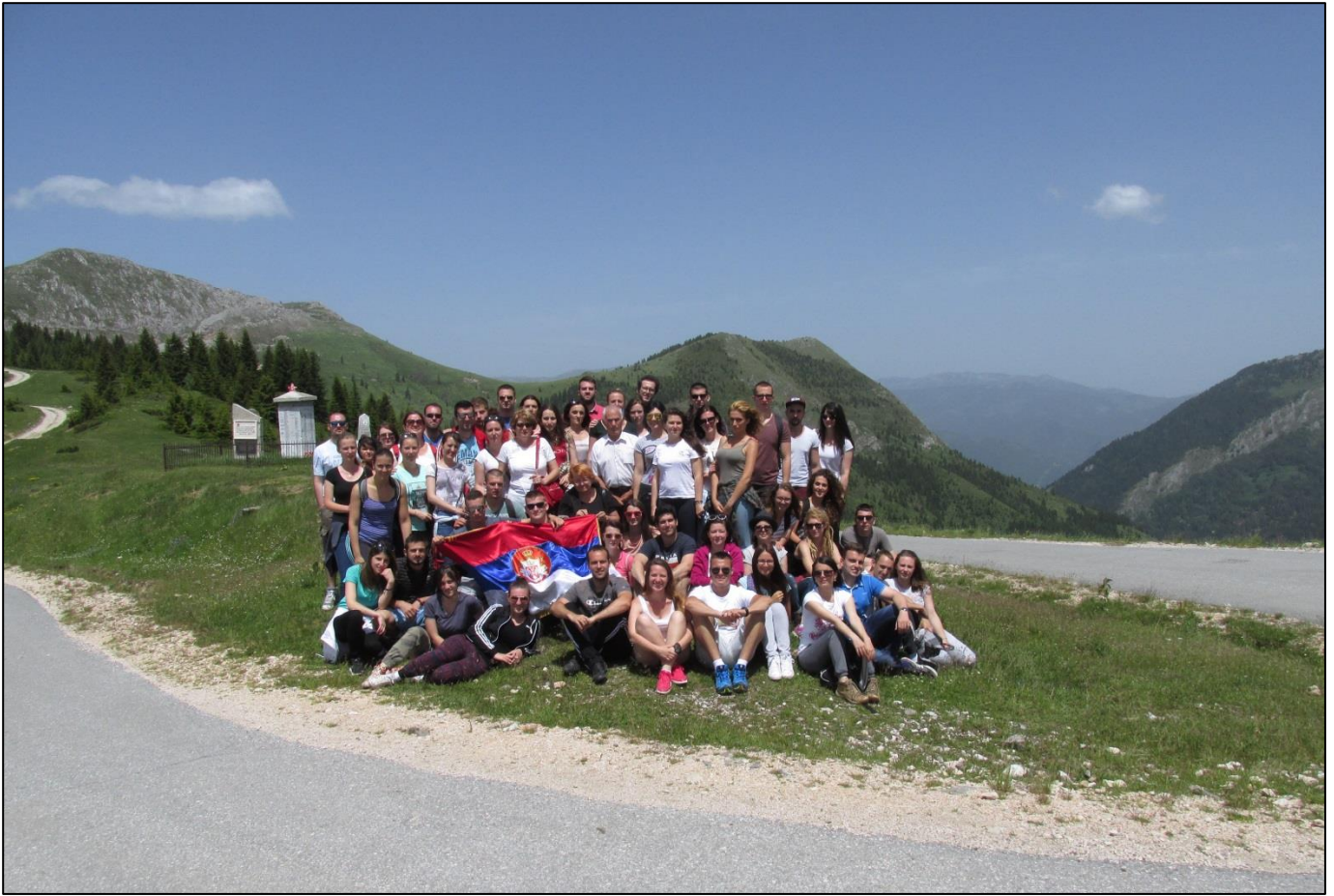
Превој Чакор (1849 м н.в.)