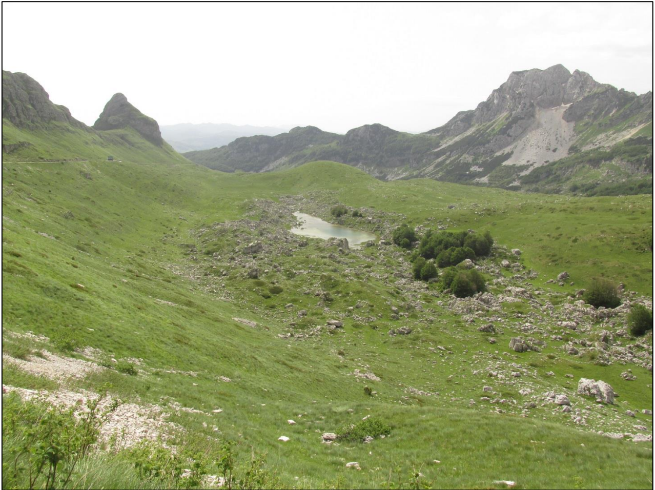
Валов Пошћенске долине на Дурмитору, поглед на Валовито језеро и Стожину (1908 m н.в.)