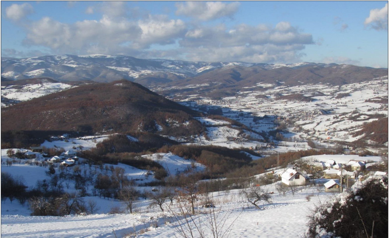
Поглед на долину Дежевске реке и планину Голију