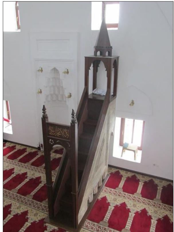
Алтун Алем џамија у Новом Пазару