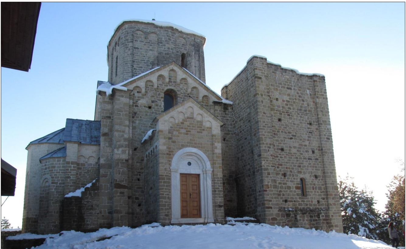
Манастир Ђурђеви Ступови