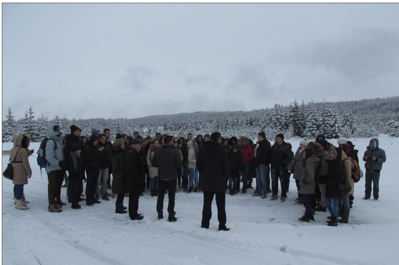
Посета ски центру „Жари“ на Пештеру