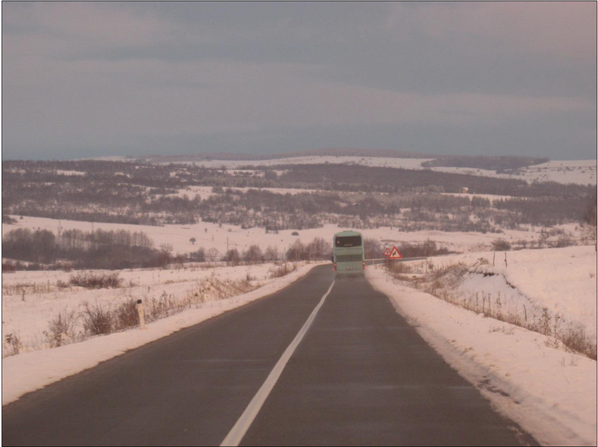
Пут на Пештерској висоравни