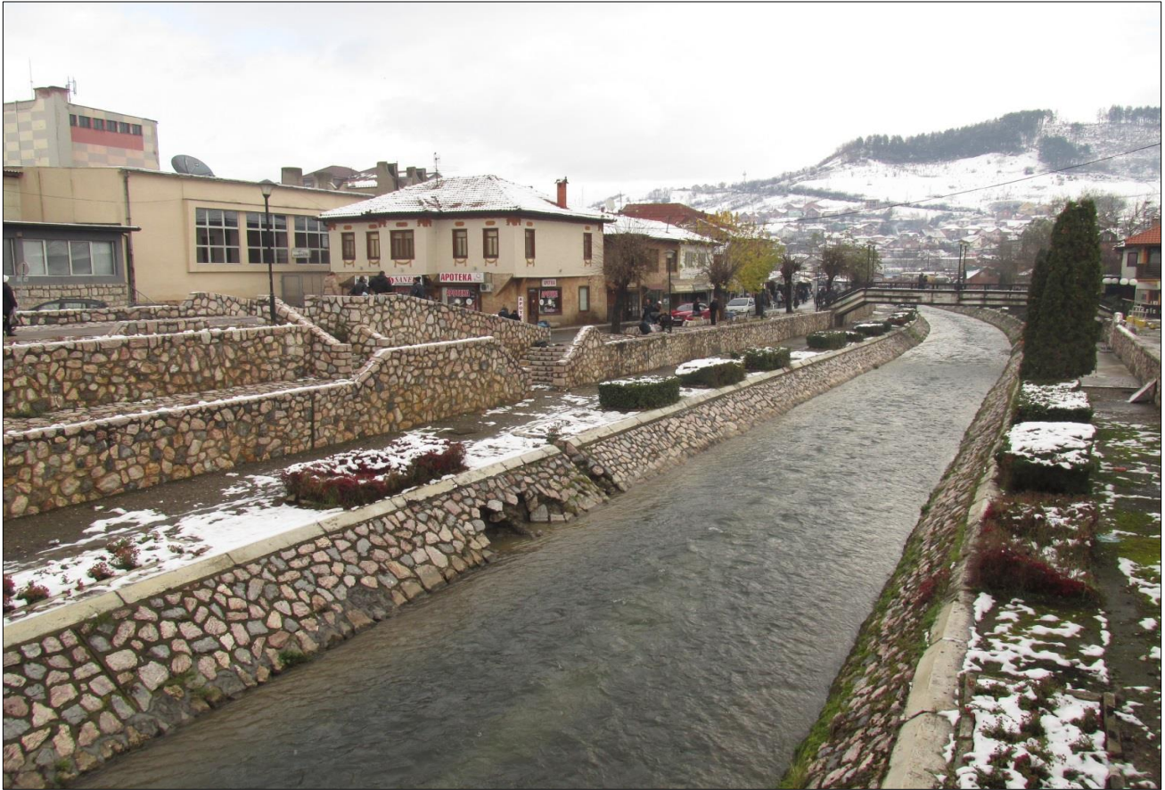
Река Рашка у Новом Пазару