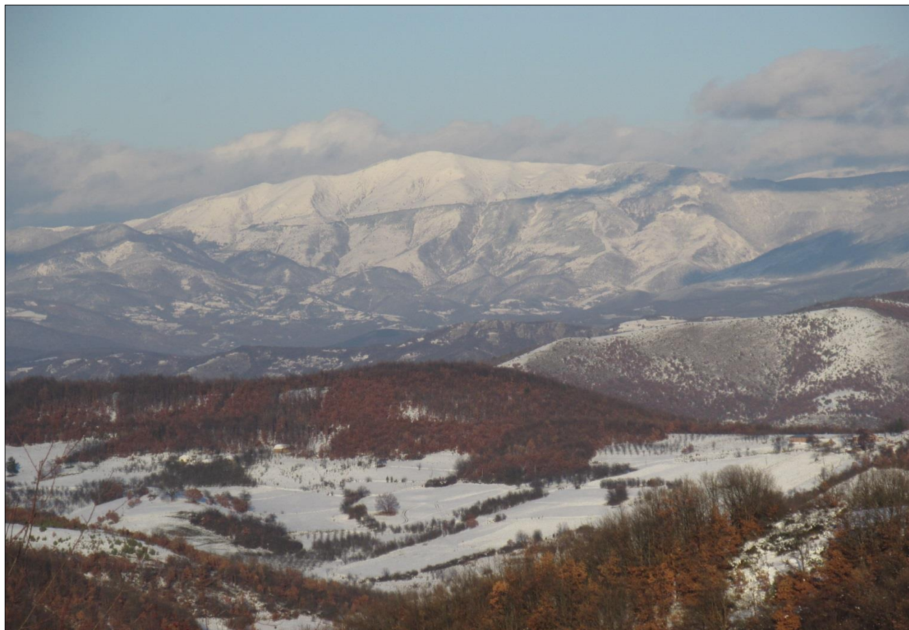
Поглед са палеовулканске купе Ђурђеви Ступови на Копаоник