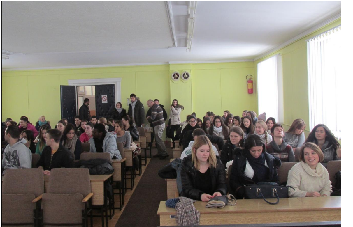
Посета Општини Сјеница