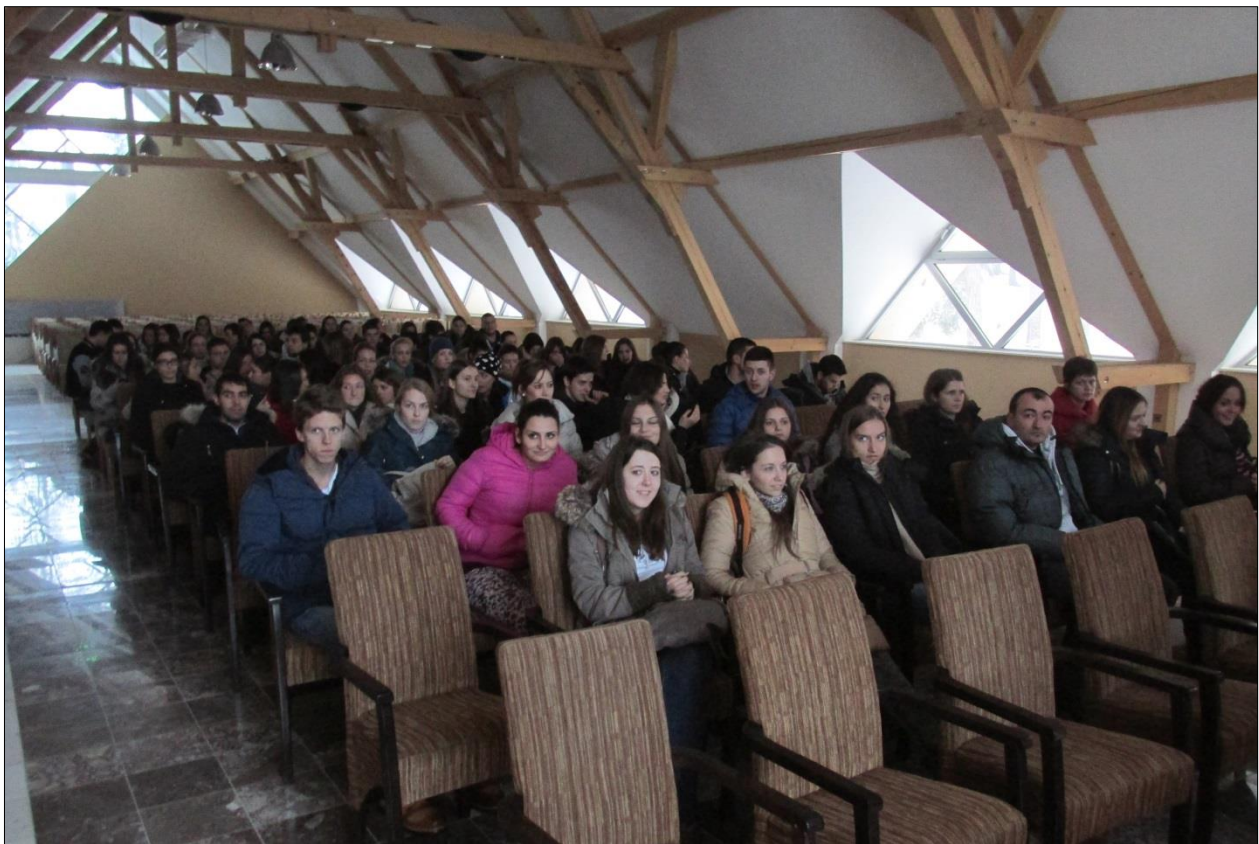
Посета хотелу „Борови“ у Сјеници