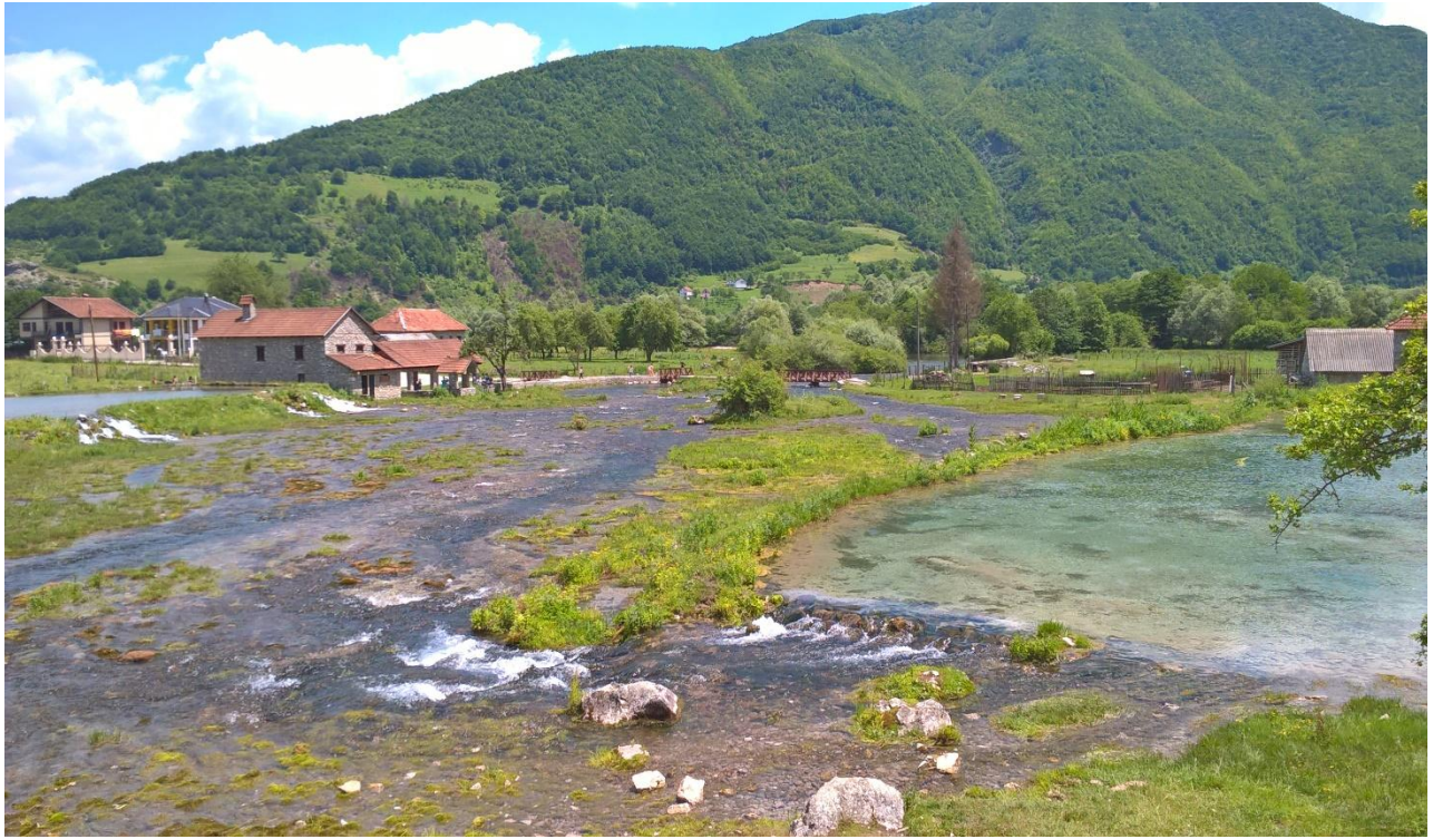
Савини (Алипашини) извори у близини Гусиња