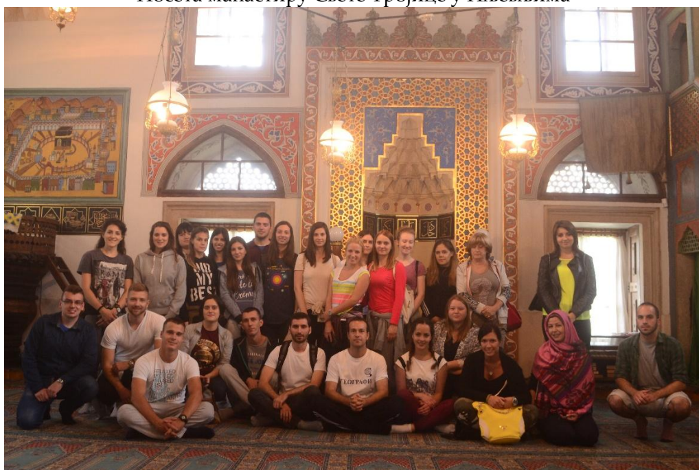
Посета Хусеин-пашиној дамији у Пљевљима (16. век)