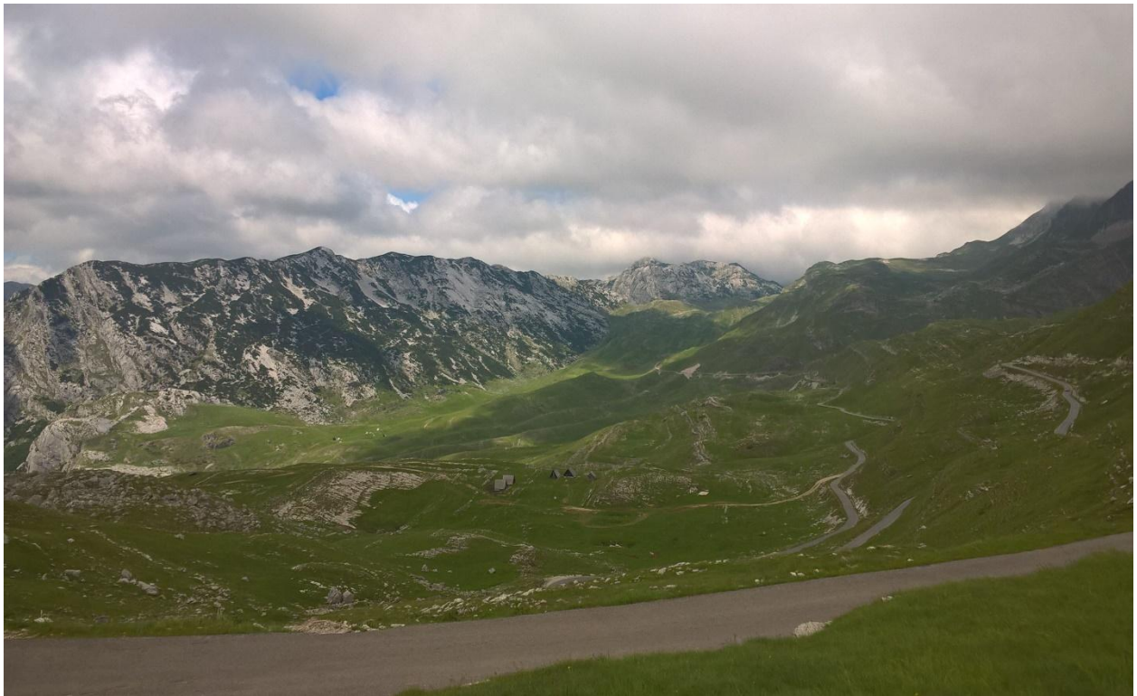
Катун и цирк Добри до на Дурмитору