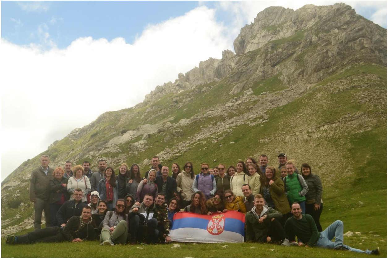
Превој Седло на Дурмитору (1907 метара н.в.)