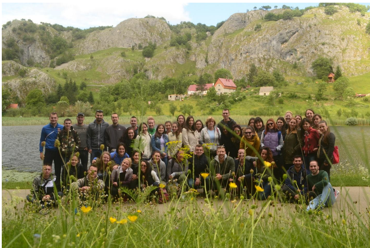
Велико Пошћенско језеро у долини Комарнице