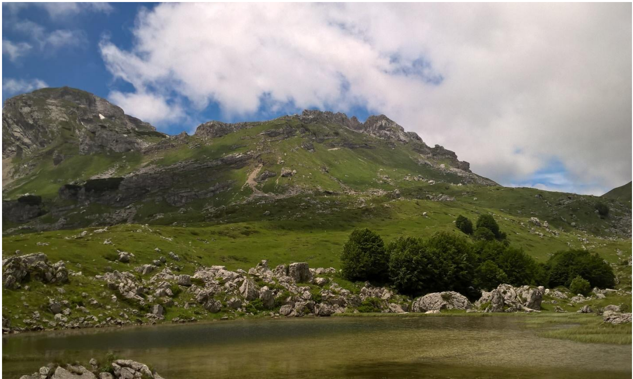
Валовито језеро у валову Пошћенске долине