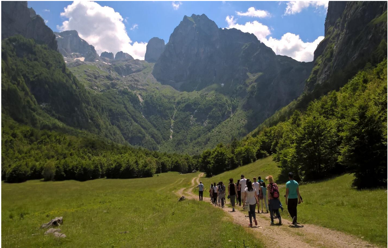
Валов Грбаје на Проклетијама