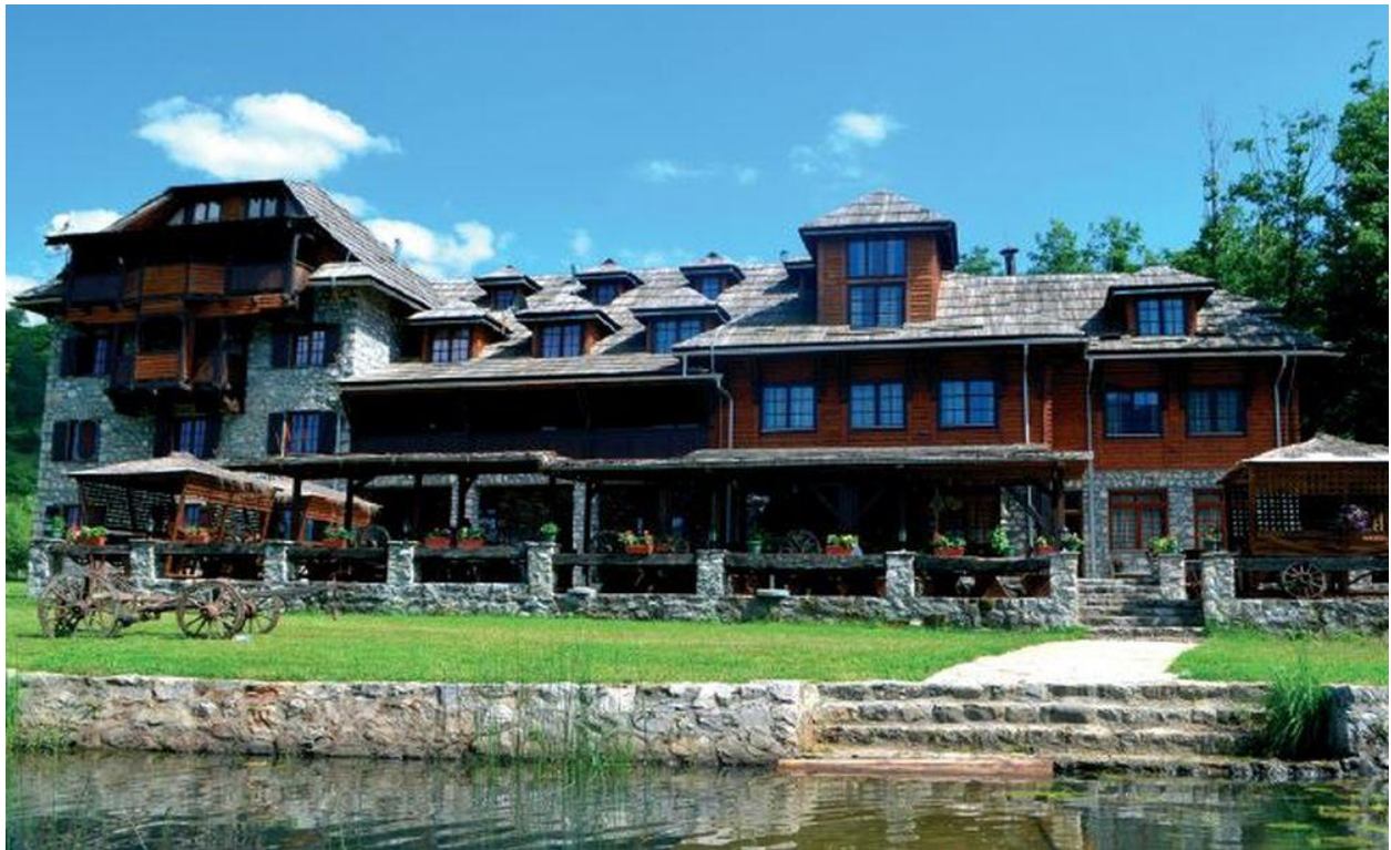
Комненово етно село у Плаву