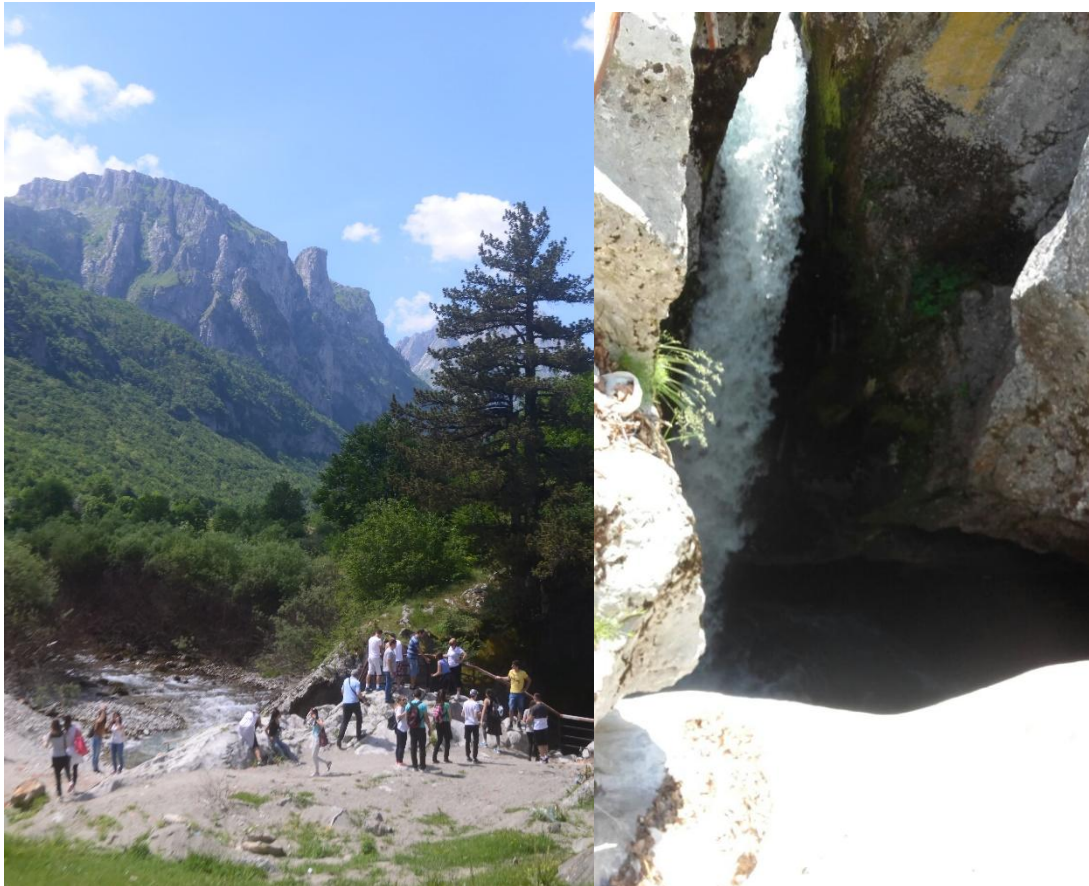
Понор Скакавац у долини Ропојане на Проклетијама