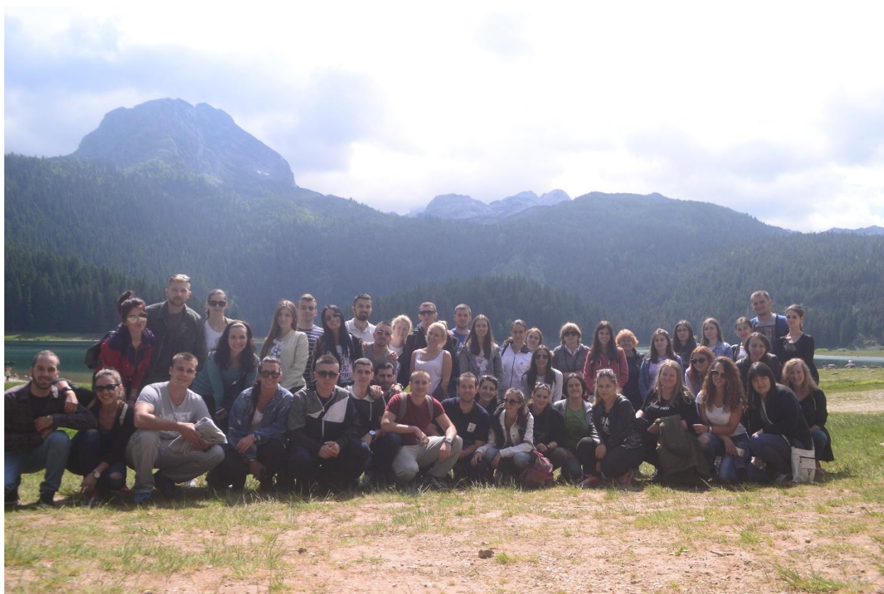
Црно језеро на Дурмитору