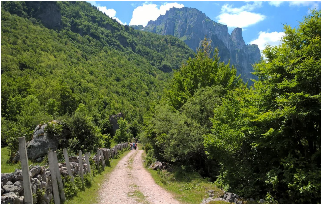
Повратак са Савиног ока