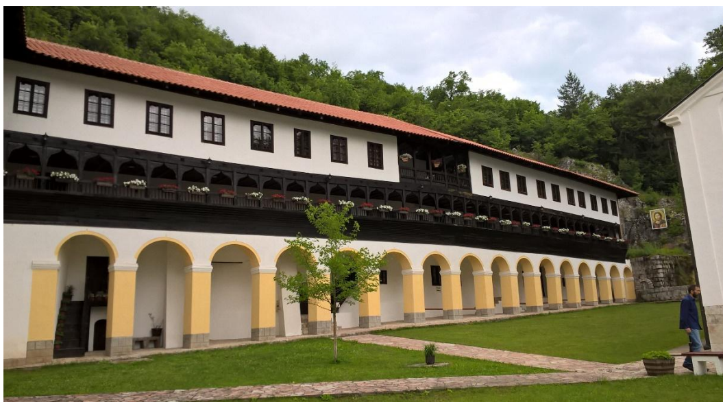
Посета манастиру Свете Тројице у Пљевљима