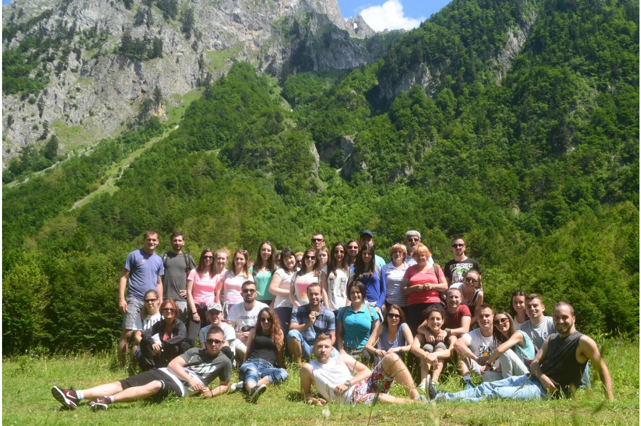
Валов Грбаје и прозорац Шупља врата на Проклетијама