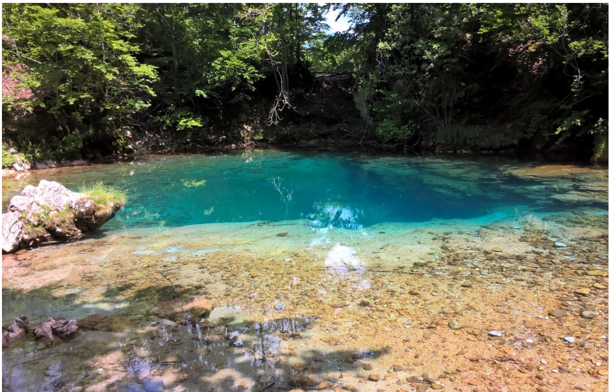
Савино око и почетак реке Скаковице у долини Ропојане