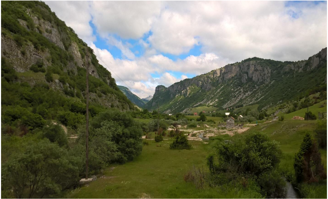
Село Комарница и почетак кањона Невидео